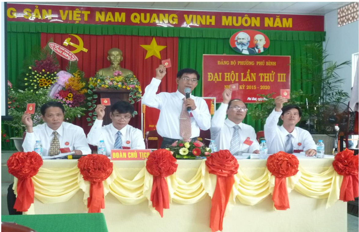
Đại hội Đảng bộ phường Phú Bình lần thứ III nhiệm kỳ 2015-2020