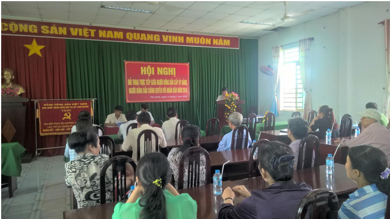
Hội nghị đối thoại giữa người đứng đầu cấp ủy Đảng, Chính quyền và Nhân dân.