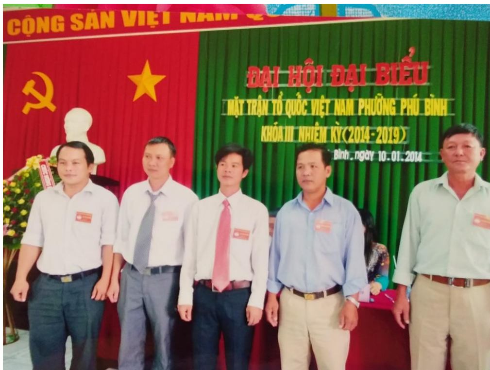
Đại hội Mặt trận Tổ quốc Việt Nam phường Phú Bình khóa III (nhiệm kỳ 2014-2019).