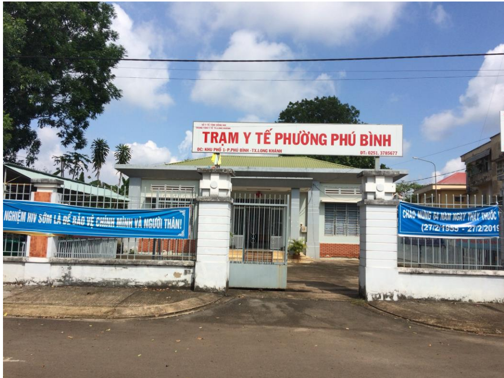
Trạm y tế phường Phú Bình