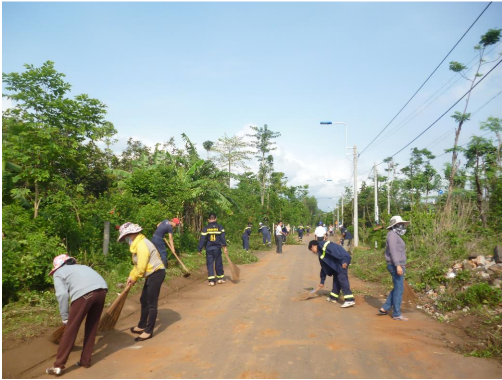
Công tác dân vận