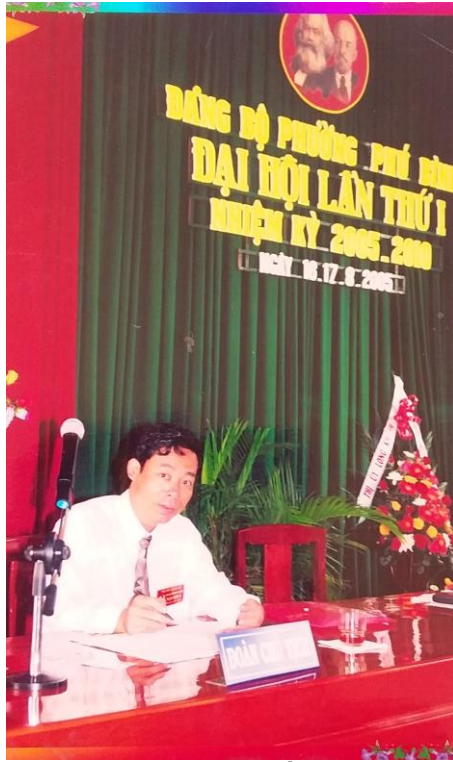
Đại hội Đảng bộ phường Phú Bình lần thứ I nhiệm kỳ 2005-2010