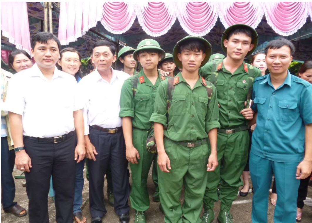
Thanh niên phường Phú Bình hăng hái lên đường nhập ngũ tham gia xây dựng quân đội, bảo vệ Tổ quốc.