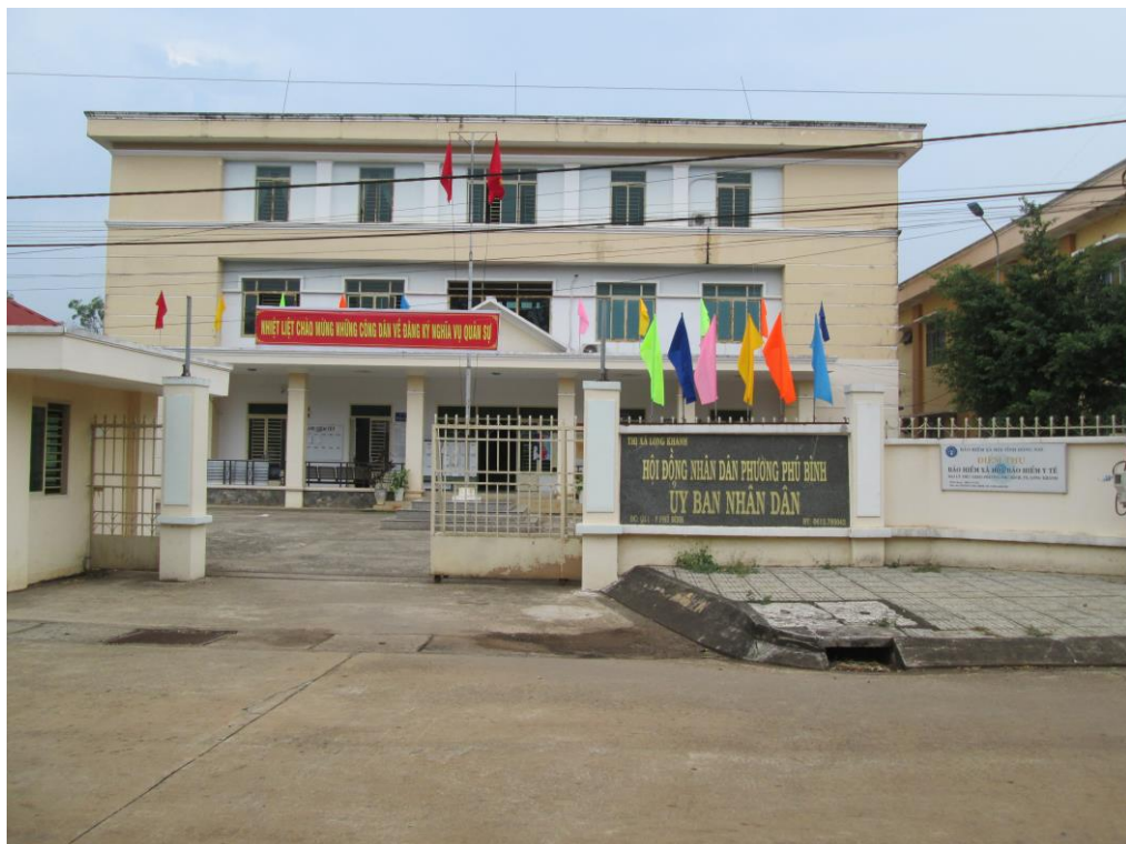
Trụ sở Hội đồng Nhân dân - Ủy Ban Nhân dân phường Phú Bình