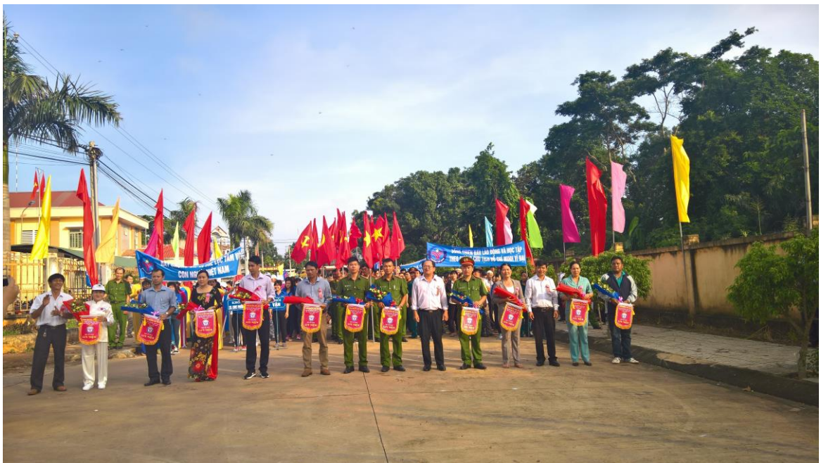
Đại hội TDTT lần thứ IV năm 2017