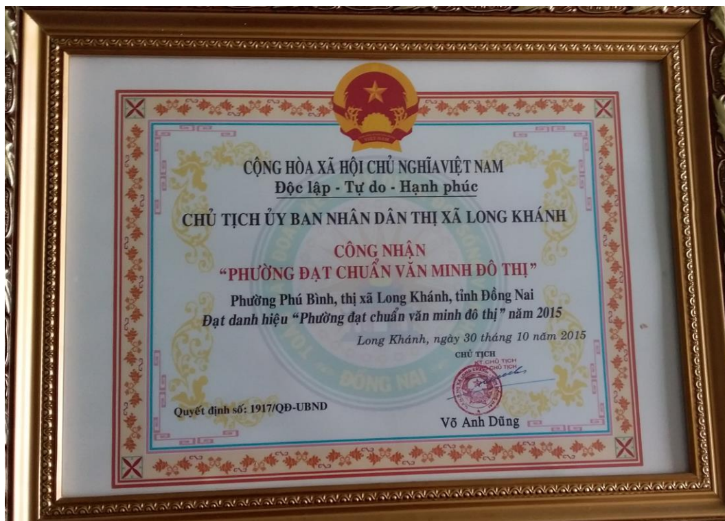
Bằng công nhận phường đạt chuẩn văn minh đô thị năm 2015