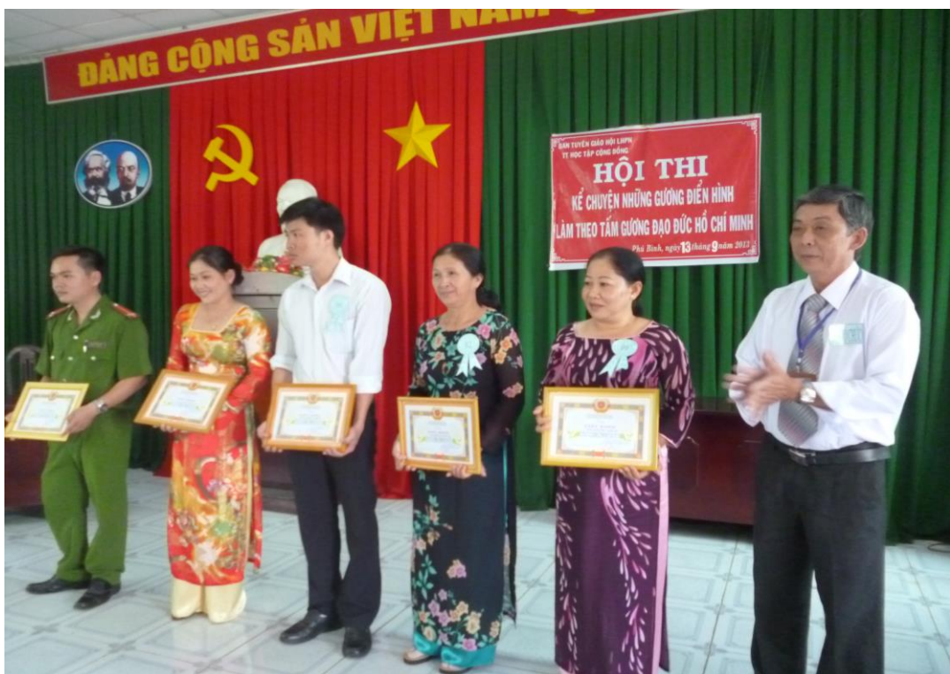
Hội thi kể chuyện gương điển hình làm theo tấm gương đạo đức Hồ Chí Minh