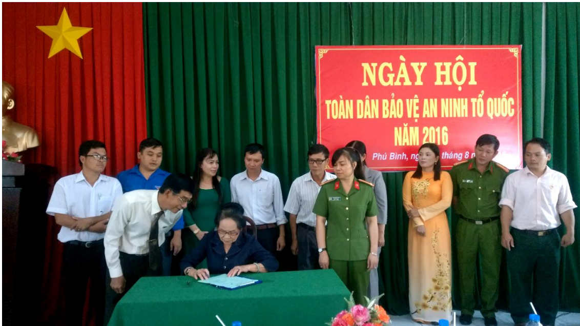
Ngày hội toàn dân bảo vệ an ninh Tổ quốc năm 2016

Những hình ảnh này sẽ được Nhà xuất bản sắp xếp trong cuốn sách