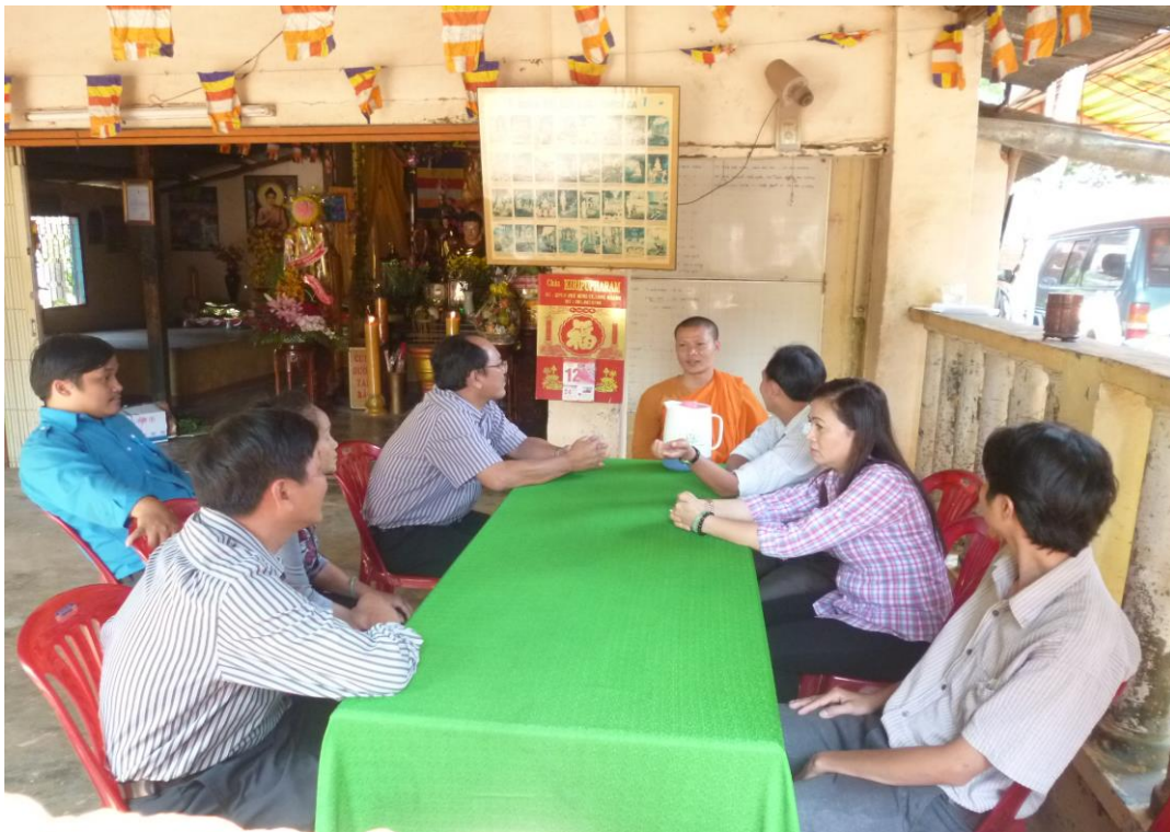
Lãnh đạo phường chúc Tết cổ truyền (Chol Chnam Thmay) của người Khmer