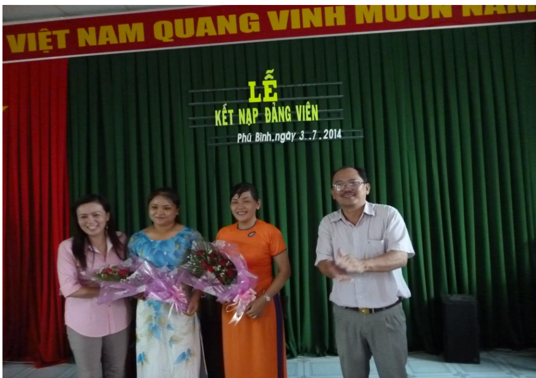
Lễ kết nạp đảng viên