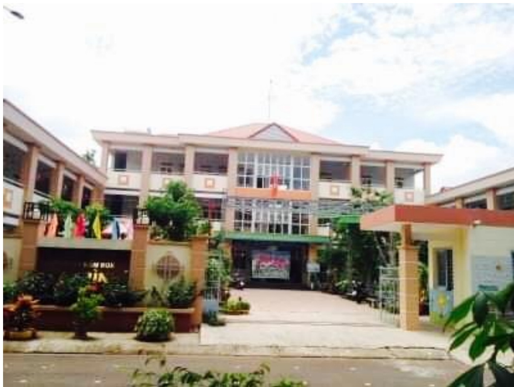
Trường Mẫu giáo Phú Bình