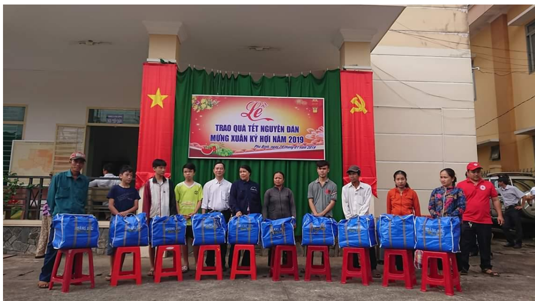
Tặng quà cho người nghèo