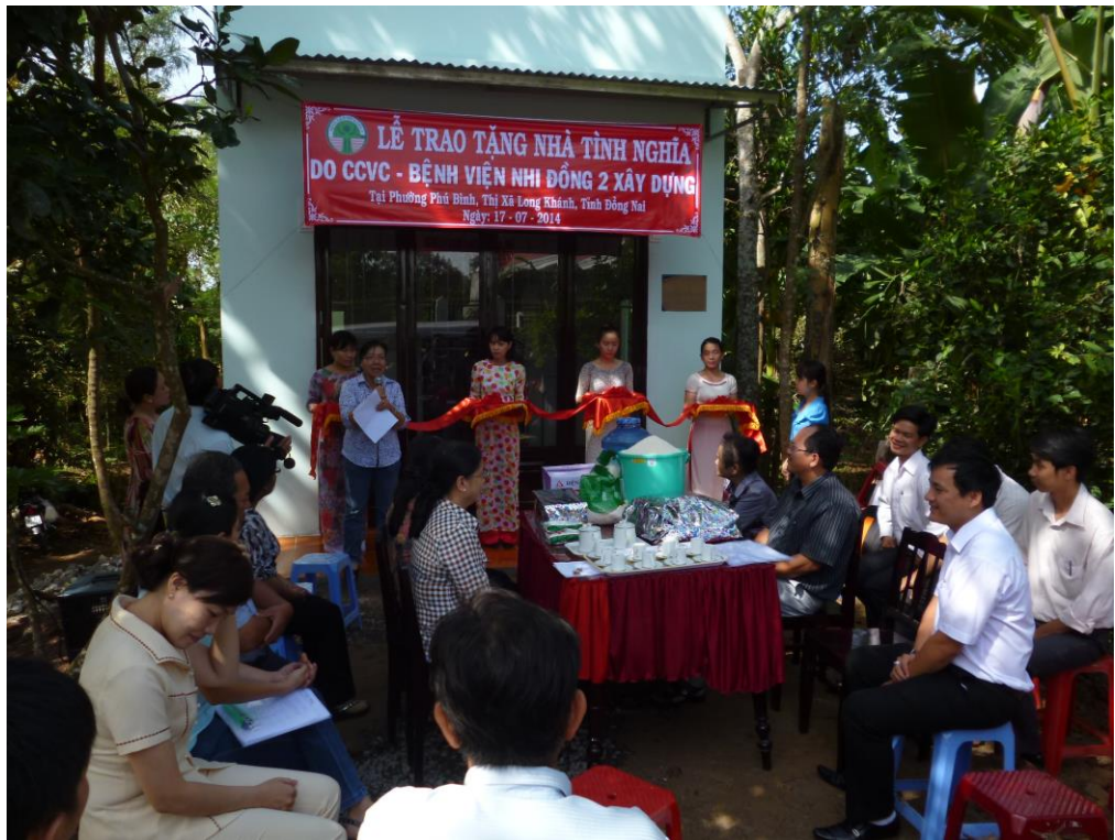
Trao tặng nhà tình nghĩa