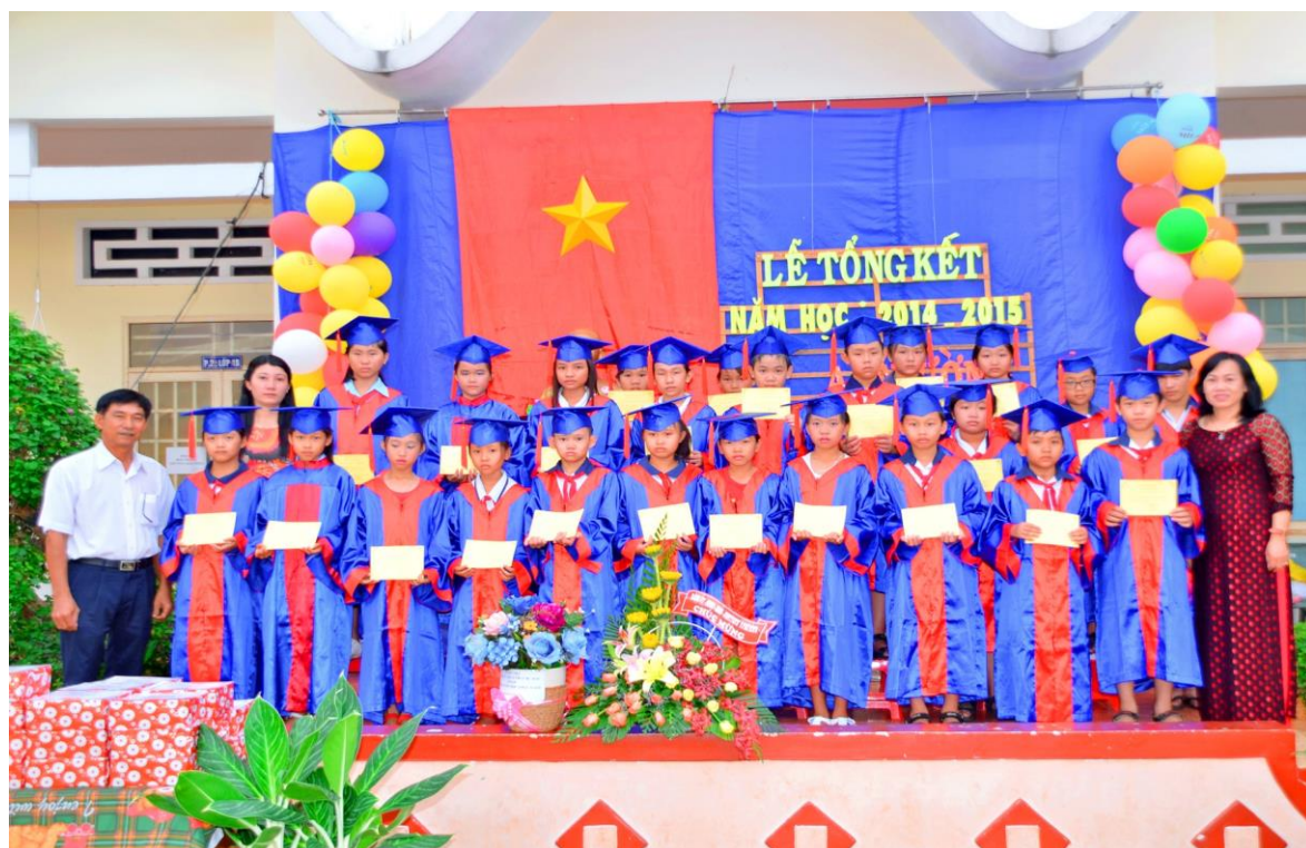
Lễ tốt nghiệp học sinh lớp 5 trường Tiểu học Phú Bình