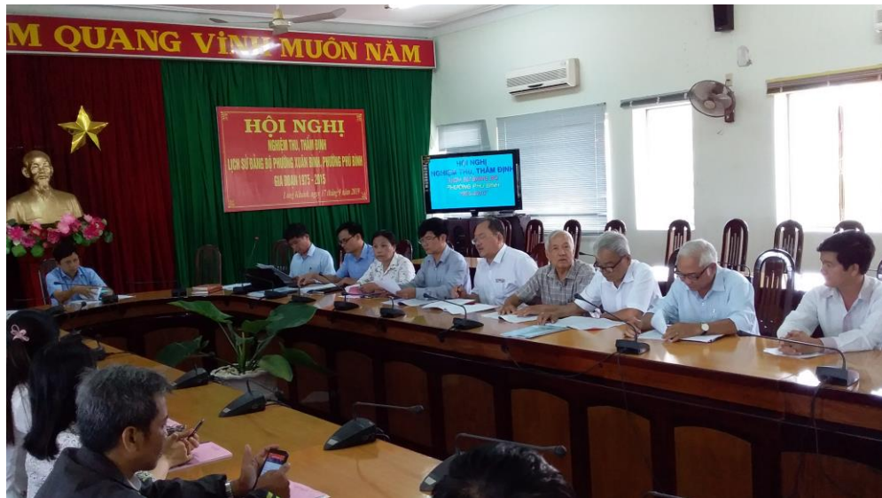
Hội nghị thẩm định lịch sử Đảng bộ và Nhân dân phường Phú Bình giai đoạn 1975-2015