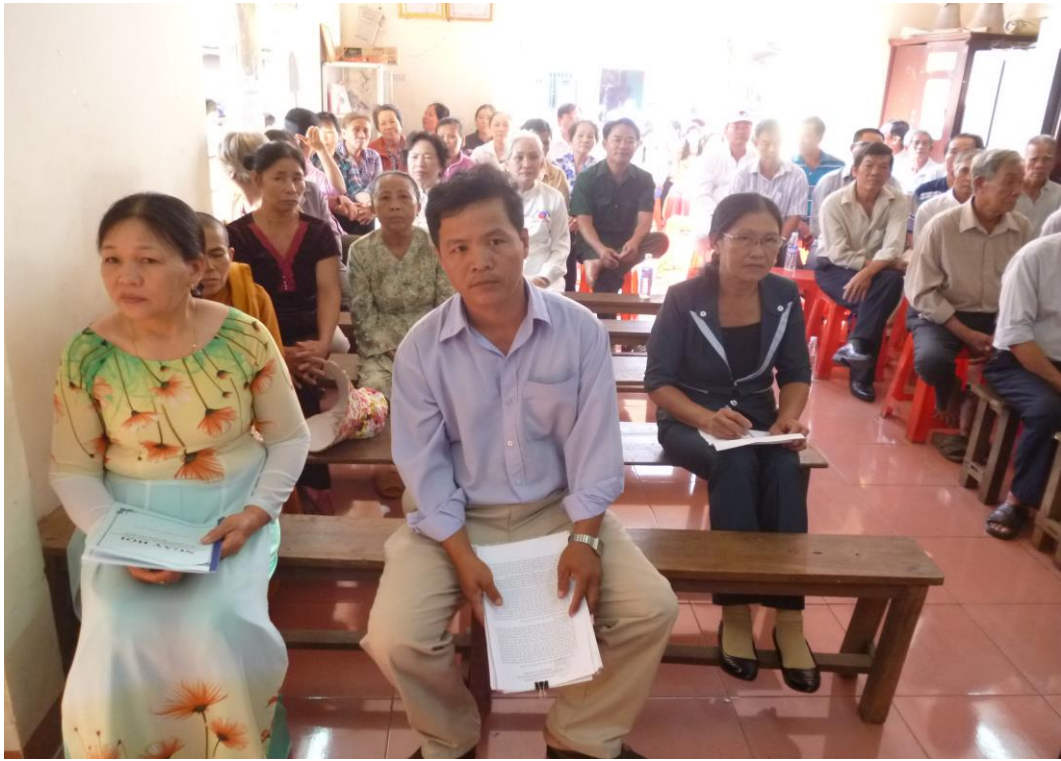
Ngày hội đại đoàn kết dân tộc khu phố 2