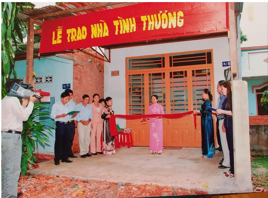
Trao tặng nhà tình thương cho hộ nghèo