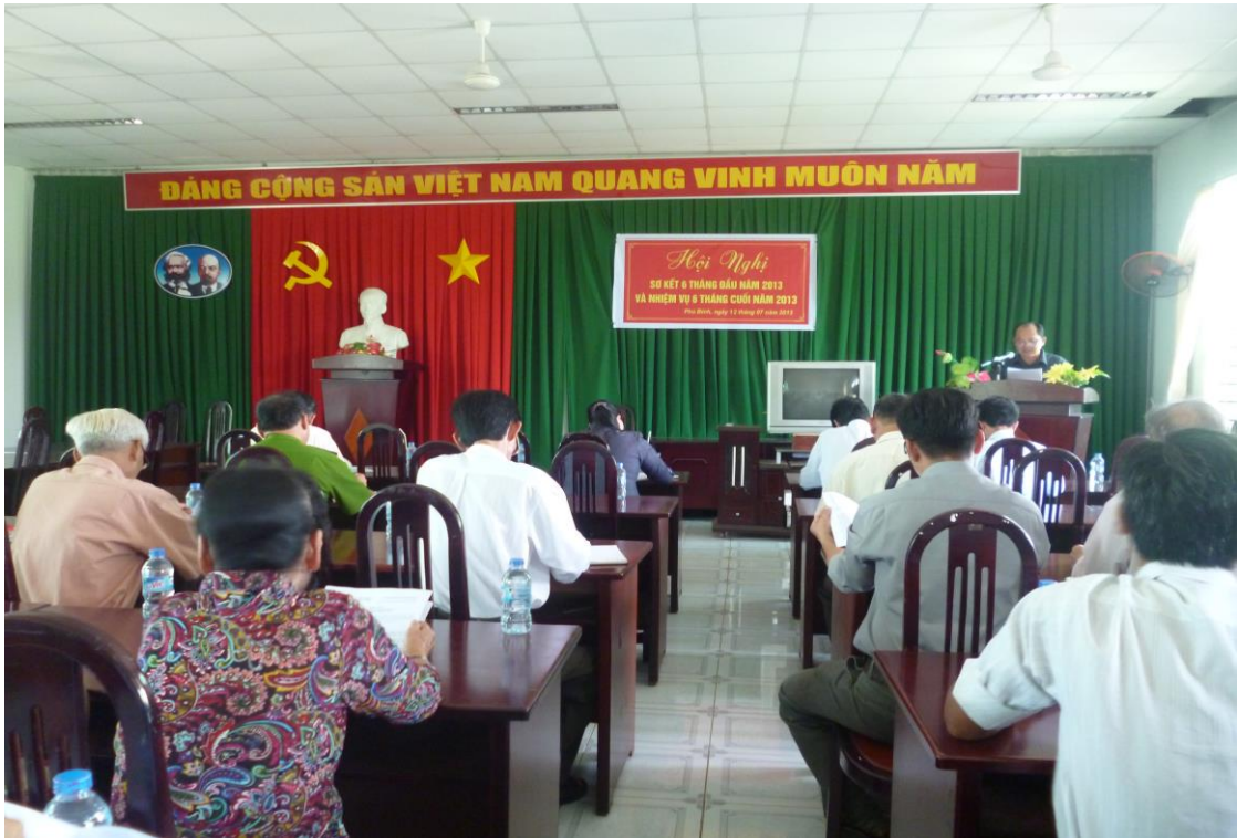
Hội nghị sơ kết công tác Đảng 6 tháng đầu năm 2013