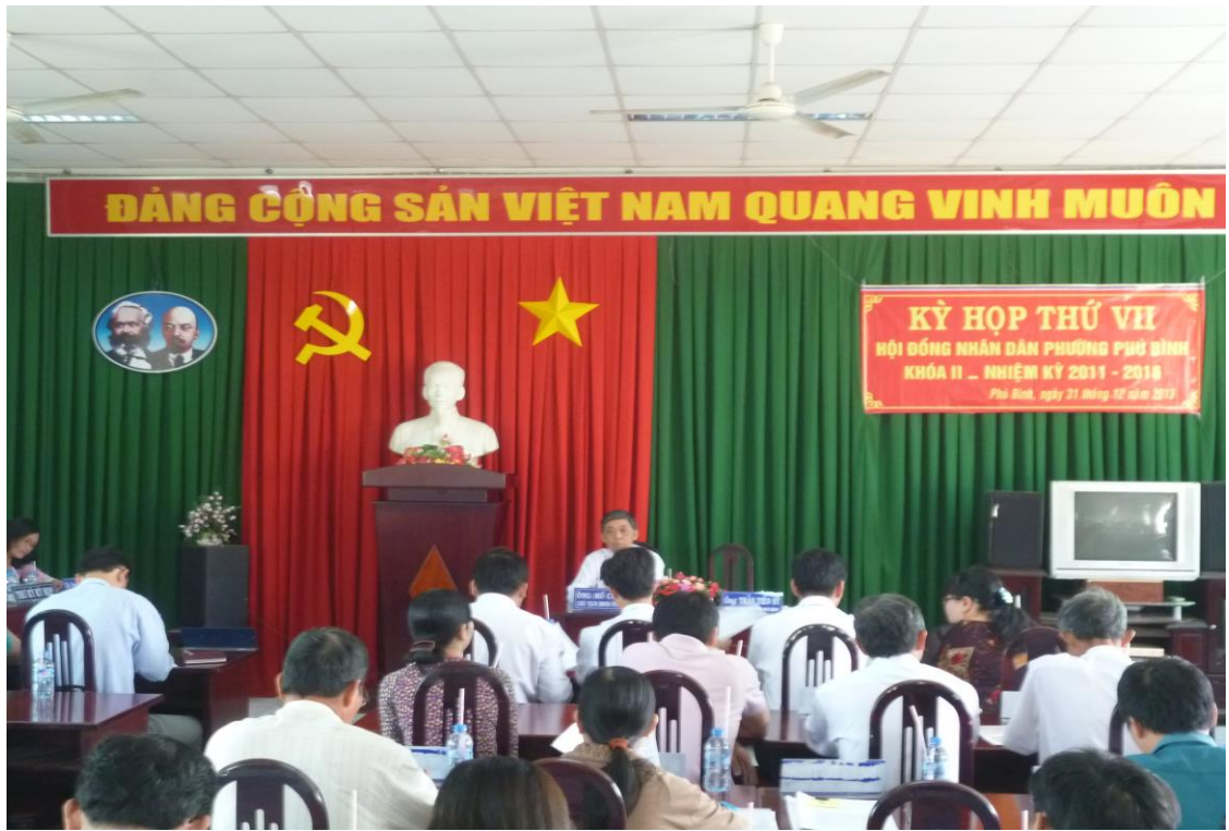
Hội đồng Nhân dân phường Phú Bình khóa II nhiệm kỳ 2011-2016, kỳ họp thứ VII.