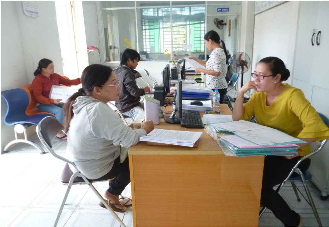
Hoạt động bộ phận một cửa phục vụ Nhân dân