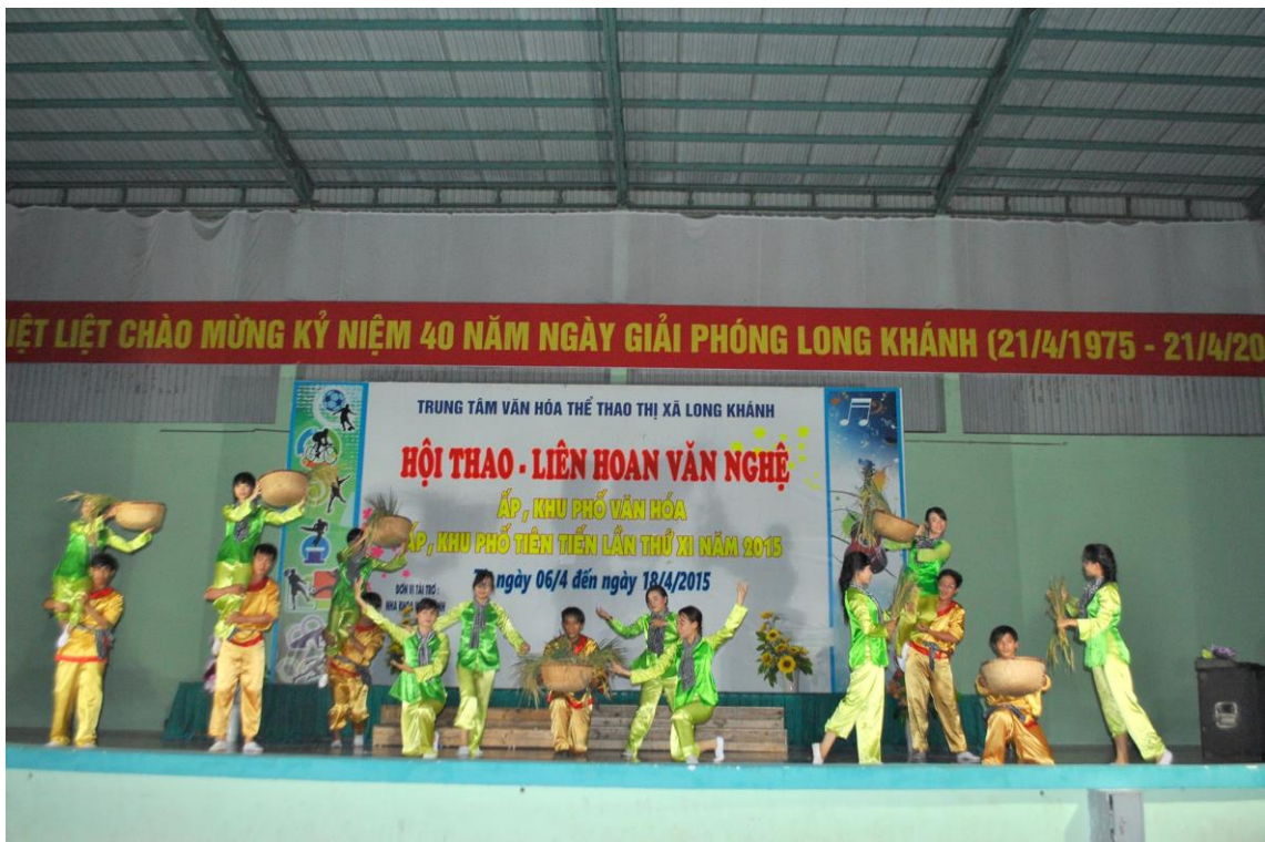
Tham gia Liên hoan văn nghệ ấp, khu phố văn hóa do thị xã tổ chức năm 2015