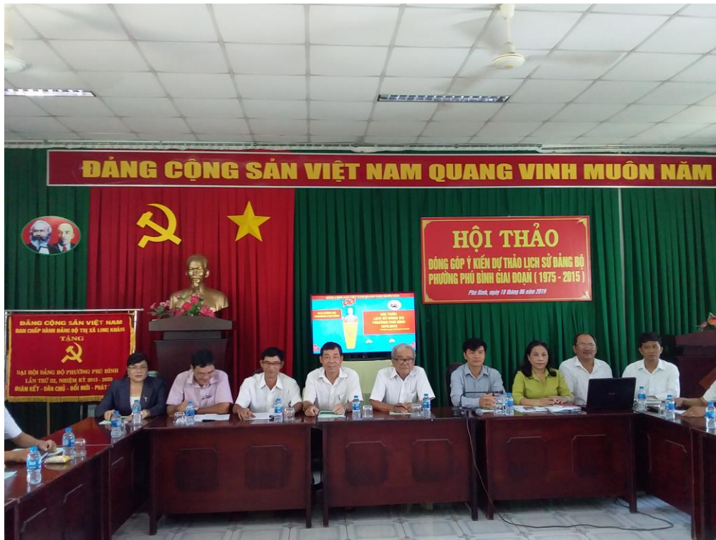
Hội thảo " Lịch sử Đảng bộ phường Phú Bình 1975-2015 ".