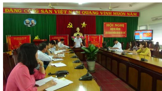
Hội nghị thẩm định: " Lịch sử Đảng bộ phường Xuân Hòa 1975-2015 ".