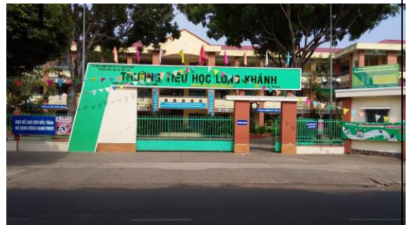
Trường Tiểu học Long Khánh