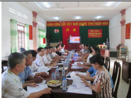
Hội thảo cuốn sách "Lịch sử Đảng bộ phường Xuân Hòa 1975-2015".