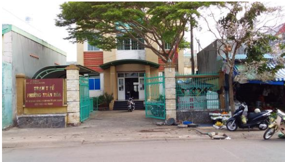
Trạm y tế phường Xuân Hòa