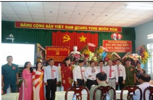
Đại hội Đảng bộ phường Xuân Hòa lần thứ III nhiệm kỳ 2015-2020