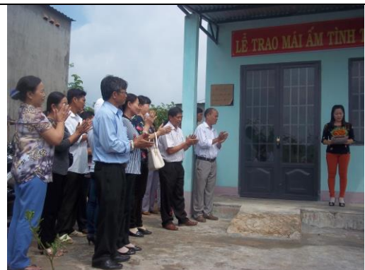
Trao tặng nhà mái ấm tình thương