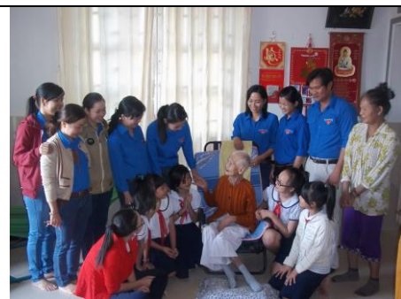
Đoàn viên thanh niên, các cháu học sinh thăm hỏi, tặng quà cho gia đình chính sách