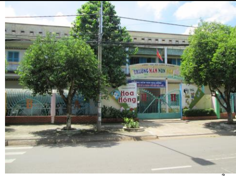
Trường Mầm non Hoa Hồng đạt chuẩn về cơ sở vật chất