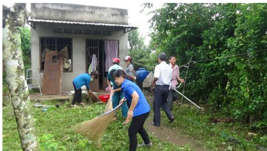
Công tác dân vận