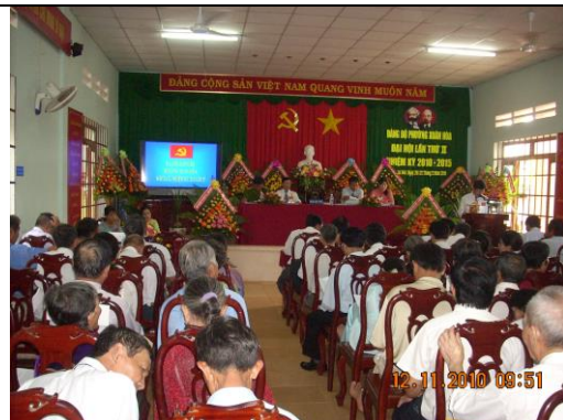
Đại hội Đảng bộ phường Xuân Hòa lần thứ II nhiệm kỳ 2010-2015.