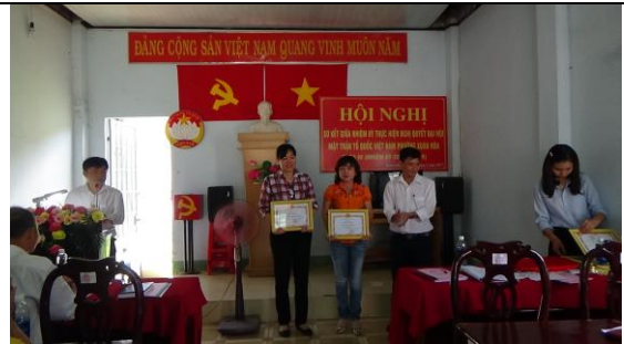
Hội nghị sơ kết giữa nhiệm kỳ thực hiện NQ Đại hội Mặt trận Tổ quốc Việt Nam phường Xuân Hòa khóa III (nhiệm kỳ 2014-2019).