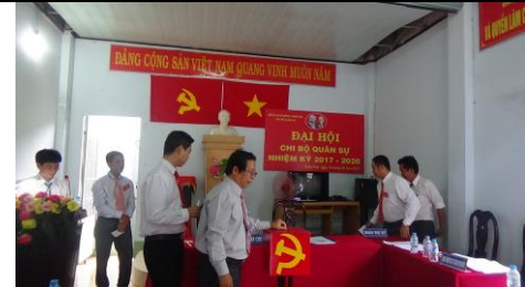
Đại hội chi bộ quân sự nhiệm kỳ 2017-2020