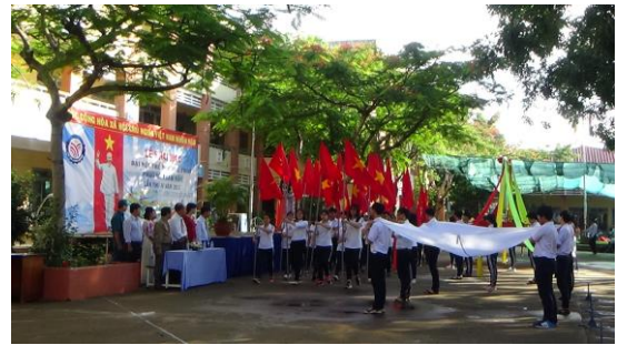
Đại hội TDTT phường Xuân Hòa lần thứ IV năm 2017