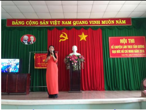
Hội thi kể chuyện làm theo tấm gương đạo đức Hồ Chí Minh