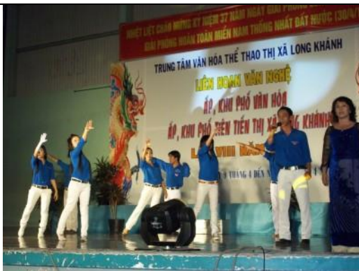
Phường Xuân Hòa tham gia liên hoan văn nghệ ấp, khu phố văn hóa do thị xã Long Khánh tổ chức năm 2012