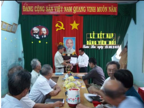
Lễ kết nạp đảng viên mới