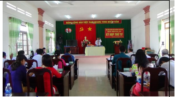
Hội đồng nhân dân phường Xuân Hòa khóa III nhiệm kỳ 2016-2021, kỳ họp thứ tư.