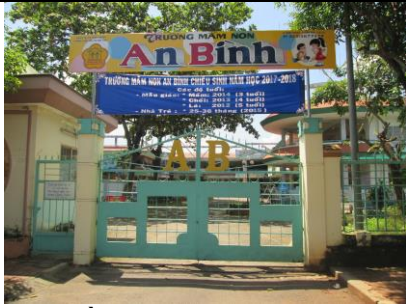
Trường Mầm non An Bình đạt chuẩn Quốc gia