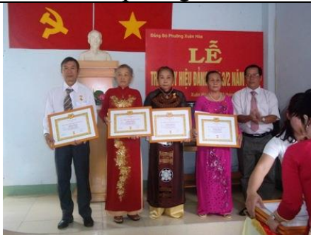
Lễ Trao tặng huy hiệu Đảng